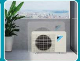
ขนาดกะทัดรัด ติดตั้งในพื้นที่แคบได้