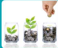
ประหยัดไฟ ด้วยระบบอินเวอร์เตอร์แบบสวิต