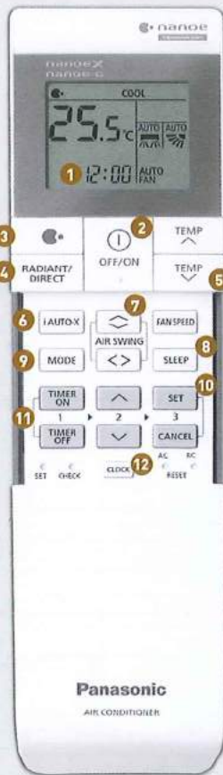
รีโมทสำหรับรุ่น ELITE INVERTER