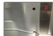
ลดขนาดช่องที่จะเข้าถึงแผงวงจรลงให้น้อยกว่า 4 มม.

ปัญหาจิ้งจกทำความเสียหายให้แผงวงจรเป็นปัญหาที่พบมาก ในต่างจังหวัดทำให้ลูกค้าไม่กล้าใช้งานเครื่องปรับอากาศระบบอินเวอร์เตอร์ โดยที่จิ้งจกขนาดของช่องต่างๆ ที่สามารถเข้าตัวแผงวงจรลงให้น้อยกว่า 4 มม. เพื่อป้องกันไม่ให้จิ้งจกและสัตว์อื่นๆ เข้าไปทำความเสียหาย