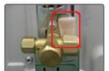
ติดตั้งเตอร์ป้อนกับในช่องที่กว้างกว่า 4 มม.