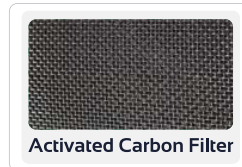
Activated Carbon Filter