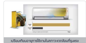
เปรียบเทียบอายุการใช้งานในสภาวะแวดล้อมที่รุนแรง

แผงคอยล์เย็นและคอยล์ร้อนแบบ Golden Fin มีประสิทธิภาพในการระบายความเย็นและความร้อนได้ดี ทำให้เพิ่มประสิทธิภาพการไหลเวียนของสารทำความเย็น มีคุณสมบัติช่วยยืดอายุการใช้งานเครื่องปรับอากาศ สามารถทนต่อฝนกรด ช่วยป้องกันการกัดกร่อนของไอเค็มบริเวณชายทะเลและสารเคมีที่มีฤทธิ์กัดกร่อนอื่นๆ ในย่านโรงงานอุตสาหกรรม ได้มากยิ่งขึ้น